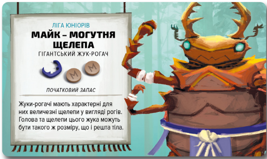
Карта борця: сторона Ліги Юніорів